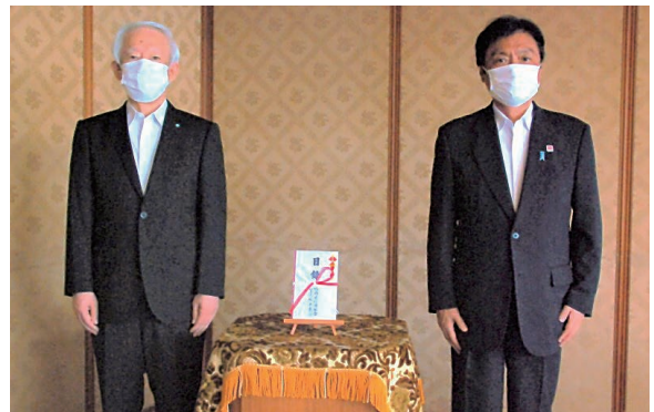
9月1日 福岡県庁にて応援金を寄付しました

福岡県が募集する「新型コロナウイルス医療従事者応援金」の趣旨に賛同し、7月1日から8月31日までの間「医療従事者応援定期預金」の募集を行い、お預け入れいただいた金額の0.02%相当額の1,729,526円を応援金として福岡県へ寄付しました。