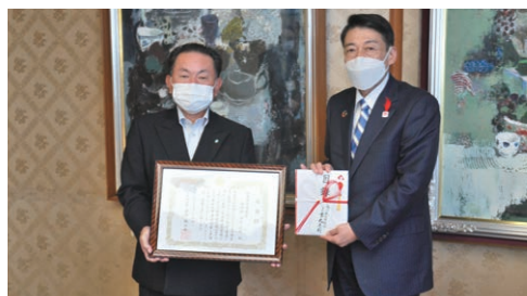
10月25日 福岡県庁にて応援金を寄付しました

今回の寄付で、昨年度から取り組んできた新型コロナウイルス医療従事者応援金の寄付金累計額は8,852,741円となりました。