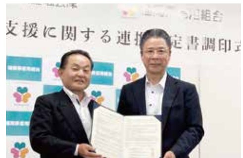
9月1日に日本政策金融公庫と事業承継支援に関する連携協定を締結しました

後継者がいない等の理由により事業譲渡を考えているお取引先があれば、全国152支店のネットワークを持つ日本政策金融公庫が展開する「事業承継マッチング支援」を活用して買い手を探す支援であり、お取引先の利益と地域経済の活性化に貢献できるものと考えています。