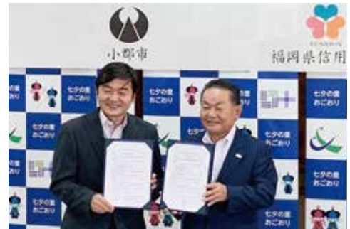
8月5日に小郡市と包括連携協定を締結しました

8～9月に延べ6日間小郡支店でマイナンバーカード登録支援活動を行い、マイナンバーカード79名、マイナポイント30名の方の登録のお手伝いをしました。