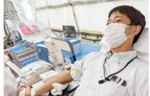
献血に参加する職員