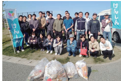
清掃活動に参加する職員