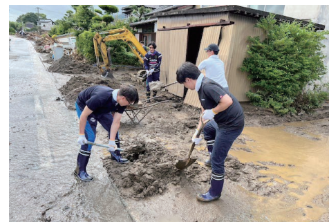
ボランティア活動の様子